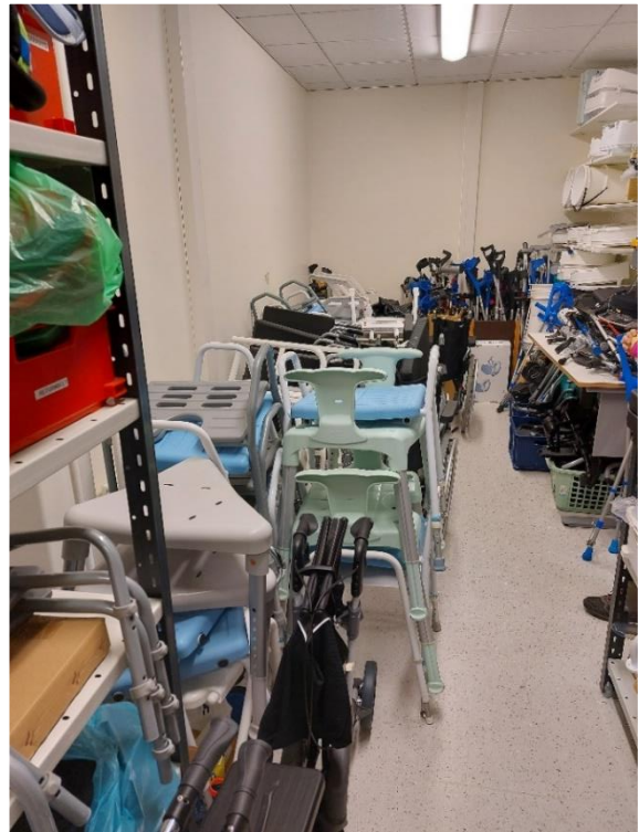
Kuvat 4–5. Yleiskuvia läntisen alueen pienemmästä apuvälinevarastosta.