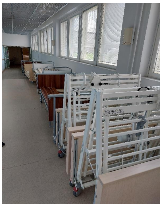
Kuva 10. Apuvälineitä käytävällä.