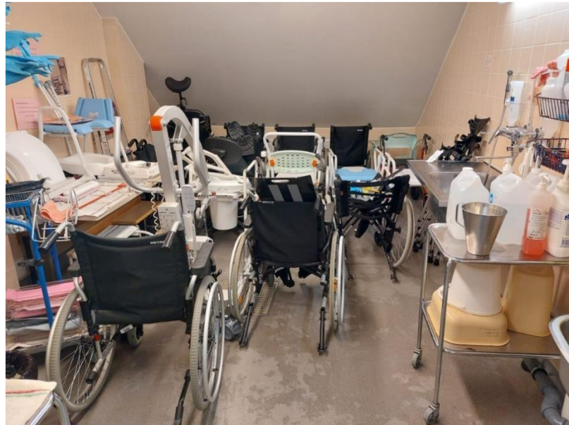
Kuvat 1-3. Yleiskuvia keskisen alueen apuvälinevarastosta ja apuvälineiden pesutilasta.