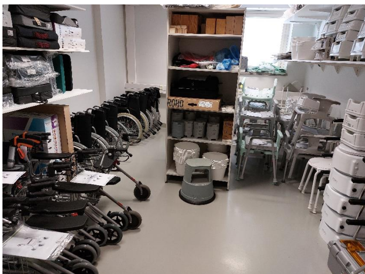
Kuvat 8-9. Yleiskuvia Loviisan apuvälinevarastosta