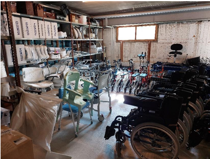
Kuvat 12–13. Yleiskuvia Askolan apuvälinevarastosta.

Henkilöstö: Askolan alueen lääkinnällisen kuntoutuksen fysioterapeutit huolehtivat yhdessä apuvälinearvioinneista ja lainauksista. Esihenkilö vastaa apuvälinetilauksista ja apuvälinevarastosta yhdessä työntekijöiden kanssa.