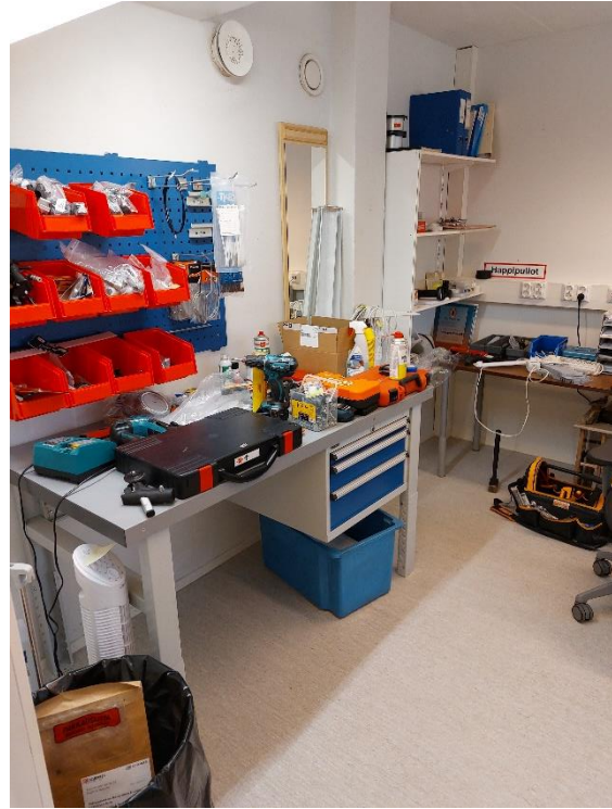
Kuva 15. Apuvälineiden huoltotila.