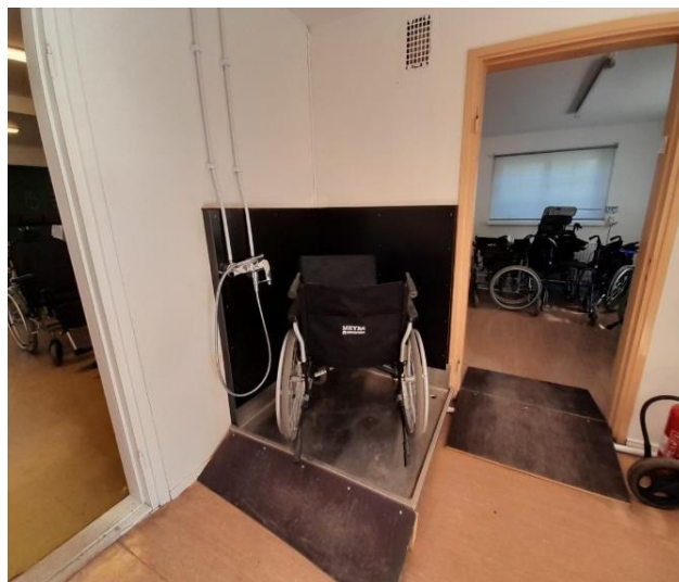
Kuvat 6–7. Yleiskuvia läntisen alueen isommasta apuvälinevarastosta.