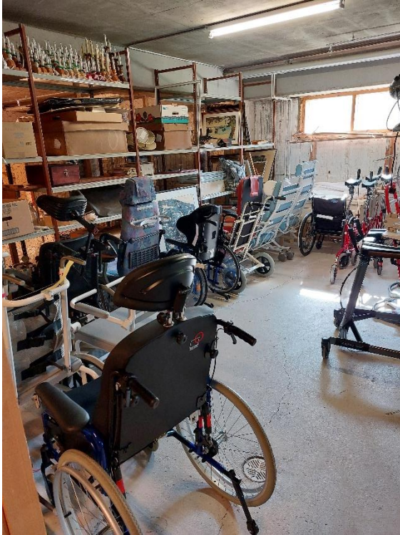
Kuva 14. Yleiskuva apuvälinevarastosta.