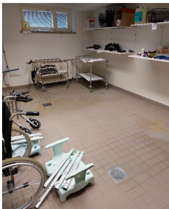
Kuva 11. Apuvälineiden pesutilat.